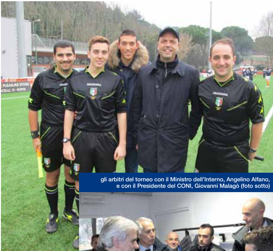
gli arbitri del torneo con il Ministro dell'Interno, Angelino Alfano, e con il Presidente del CONI, Giovanni Malagò (foto sotto)

Un gesto importante, che non costa niente e vale parecchio. Un gesto talmente ovvio che spesso passa in cavalleria. Non stavolta, segno che la voglia di lavorare insieme per debellare la violenza sui campi di calcio è più che una speranza.