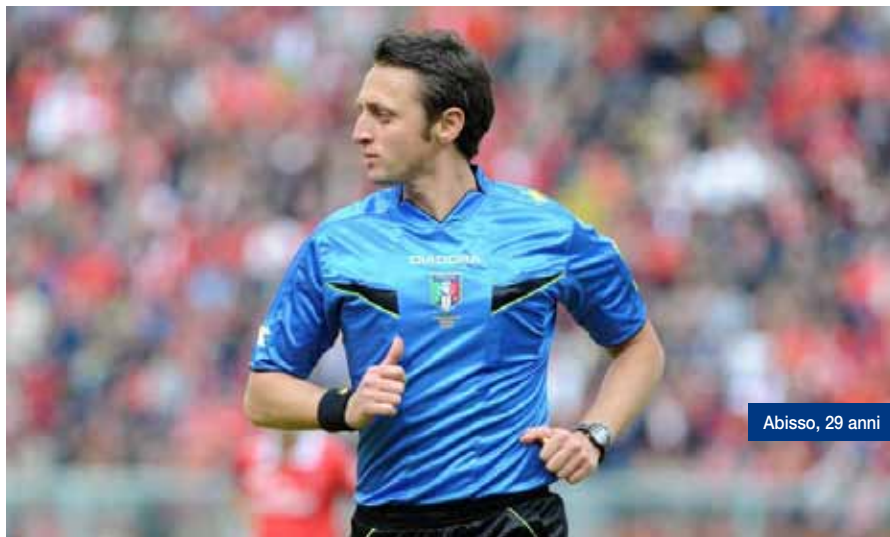
Abisso, 29 anni